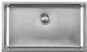
水槽 KE - R15 Vintage